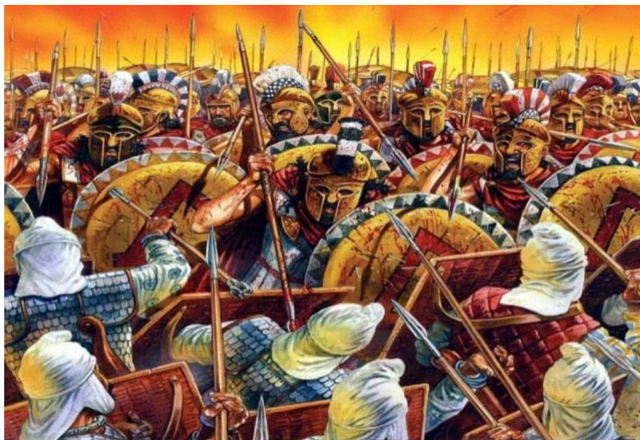
Η μάχη του Μαραθώνα Τάξη Δ Κεφ. 16 Ηλιάδης Ηλιάς

Ας μην ξεχνάμε το πώς από τον βάλτο του Μαραθώνα φθάσαμε εδώ. Η απεικόνιση στην ποικίλη Στοά που περιγράφει ο περιηγητής Πausanias είναι η σύνδεση που έχουμε της μάχης με το έλος..